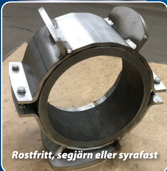
Rostfritt, segjärn eller syrafast