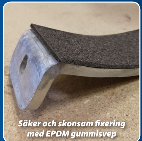
Säker och skonsam fixering med EPDM gummisvep