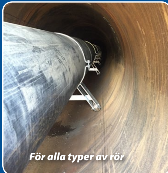
För alla typer av rör