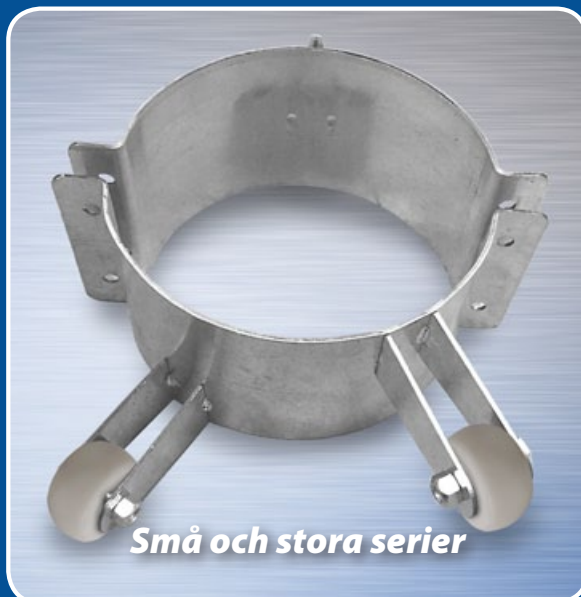
Små och stora serier